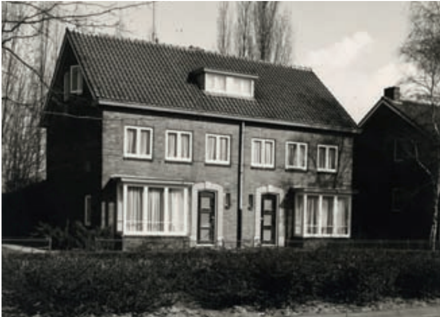
Foto uit 1971 van het huis aan de Azalealaan 51. Hier vestigden zich enkele Zusters van Liefde afkomstig uit het Liefdesgesticht op de Markt.

nieuw orgel in de kloosterkapel, een bedrag van 3300 gulden aangeboden.