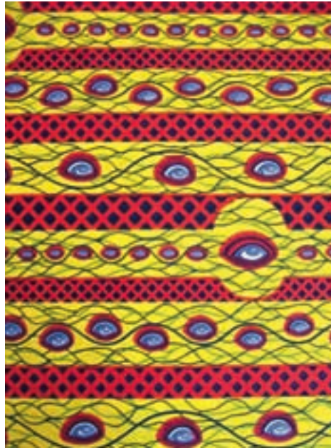
Dessins 'Kom naar mijn slaapkamer' en 'Het oog van mijn rivale'.

einde van de 19 e eeuw gebeurt dat met de roldrukmachine: twee walsen drukken het patroon in hars snel en nauwkeurig op de stof. Deze lijmdruk raakt beter bekend als wasdruk of waxprint . De imitatie-batikstoffen zijn veel gelijkmatiger dan echte batik: het craquelé is overal hetzelfde en heeft haar grillige karakter verloren. Maar door de goedkope prijzen vinden deze stoffen toch een afzetmarkt.