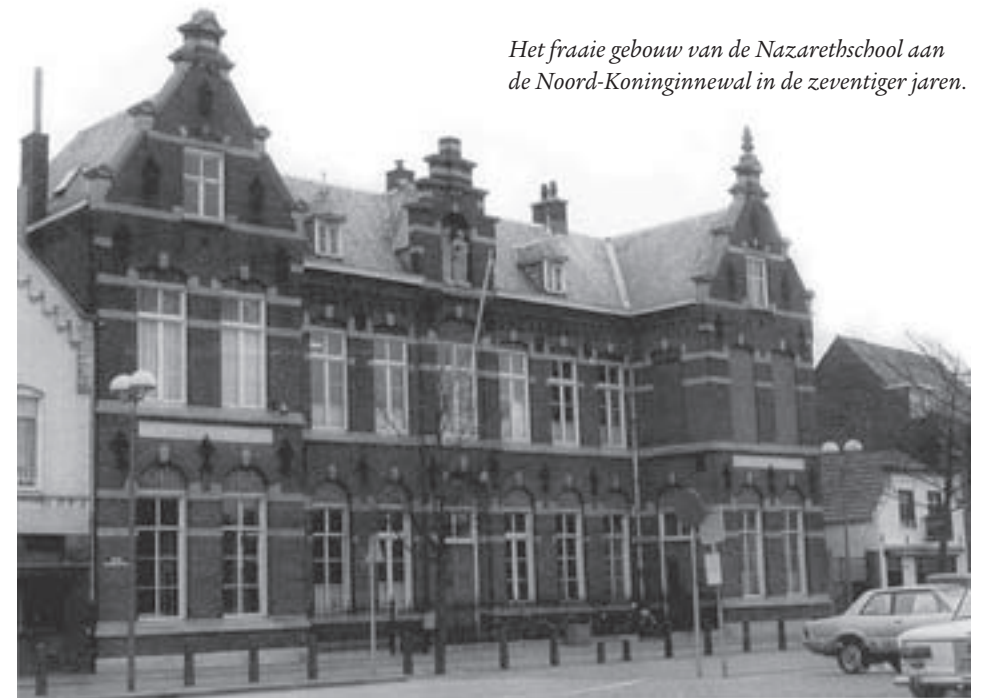
Het fraaie gebouw van de Nazarethschool aan de Noord-Koninginnewal in de zeventiger jaren.

Nauwelijks waren er vijf jaar verstreken, toen toch weer tot uitbreiding moest worden overgegaan. In de bestaande gebouwen was geen plaats meer te vinden. Daarom werd aan de Noord-Koninginnewal een stuk grond aangekocht. Onder leiding van architect Goyaarts verrees daar het gebouw van de Nazarethschool die op 30 april 1907 werd ingewijd. Bij die gelegenheid werden de Zusters van Liefde geprezen voor hun ijvervolle en liefderijke inzet voor het godsdienstonderwijs. De steeds aangroeiende Helmondse bevolking