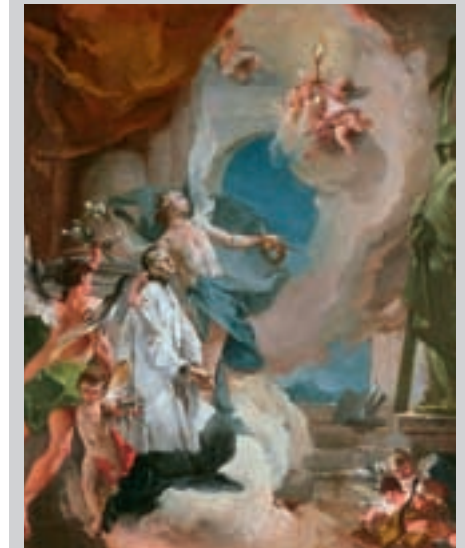
Schilderij van Aloysius Gonzaga door Giambattista Tiepolo

Direct na zijn dood werd Aloysius al als een heilige beschouwd. Spoedig werd hij in de San Ignazio te Rome begraven. Reeds 14 jaar na zijn dood werd hij zaligverklaard. In 1726 werd hij samen met Stanislaus Kostka heilig verklaard. In 1729 werd hij tot patroon van jonge studenten uitgeroepen. Ook geldt hij als beschermerheilige van pestlijders. Als symbool van de kuisheid wordt hij ook in het bijzonder tegen seksuele verzoeken aangeropen. Ten slotte is hij patroon van de stad Mantua. Zijn feestdag is 21 juni.