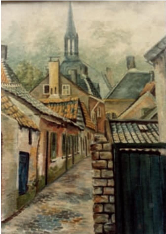
Schilderijtje van het Ketsegangse rond 1935, gezien vanaf de ingang aan de Noord Koninginnewal, in de richting van de Markt. Op de achtergrond de toren van de in 1879 gebouwde kapel van het klooster Sint Aloysius op de Markt. Links pandjes van P.J. Laukens. (schilder onbekend)

vulde in de jaren 1910 tot 1913 zowel de nieuwe als de oude schoolgebouwen verontrustend. Weer werd een terrein voor een nieuwe school bestemd, maar men durfde dat niet aan omdat nog een te zware schuldenlast op de bestaande school rustte.