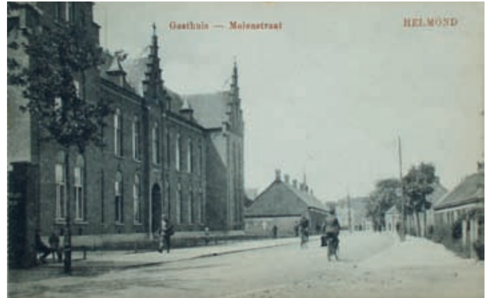
Sint Antonius gasthuis aan de Molenstraat, gebouwd in 1901 onder architectuur van J.W. van der Putten. (collectie Mevr. Hegeman - van Gotum)

Het hoofddoel in de plannen van pastoor Beugels was de verzorging van armen, noodlijdenden en zieken geweest. Die taak had hij dan ook, naast het geven van onderwijs, primair aan de Zusters van Liefde opgedragen. Het gasthuis aan het Binderseind was gesloopt en voor medische hulp was de turfschuur en de zomerkeuken van het klooster ingericht tot gasthuis. In 1844 heerste de gevreesde ziekte tyfus, veel mensen werden ziek. Om het besmettingsgevaar te beperken en uitbreiding te voorkomen, was opname in een ziekenhuis noodzakelijk. Spoedig waren de zalen van het gasthuis te klein om het oplopende aantal zieken te kunnen verplegen. De klaslokalen werden