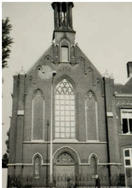
Complete façade van de kapel en het klooster Sint Aloysius aan de Markt. De foto's zijn gemaakt in 1965. De lichte vlek (linksboven op de linker foto) in het metselwerk is van reparatie na de inslag van een granaat tijdens de bevrijding van Helmond september 1944.

In 1938 werd het eeuwfeest van de Zusters van Liefde gevierd. Een feestcomité begeleidde de zusters uit het Aloysiusgesticht en het Antoniusgasthuis naar de Lambertuskerk. De Deken van Helmond hield daar een waarderende feestpreek. Zijn woorden werden later op de dag, namens de gehele Helmondse bevolking, bevestigd door burgemeester Moons. Als feestgave werd, ten behoeve van een