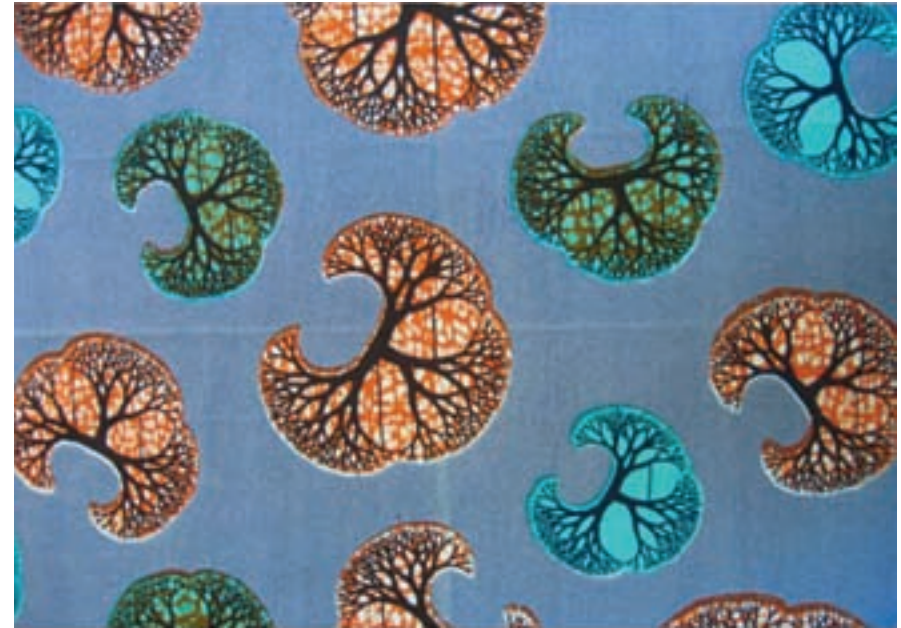
Dessin 'Het brein van Kofi Anan'.

Rond de eeuwwisseling verkoopt Vlisco de eerste khanga's aan vrouwen in Kenia, Tanganyika en Zanzibar. Een khanga is een kledingstuk dat per twee werd verkocht: een lap voor om het middel en een voor om het hoofd. Het werd vooral gedragen door Mohammedaanse vrouwen. Het was een goedkoop artikel gedrukt op dunne doek